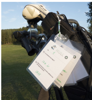
Fra Golf og Quiz

Nytt av året var Golf og Quiz , i regi av Lise Brekka og Rita Åse med ledsagere. Det var 2 events med til sammen 58 deltakere.