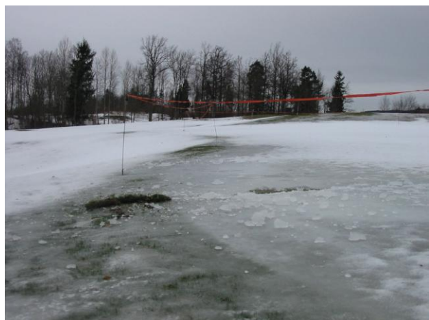
Telehiv gjør at vann blir stående på greenen.

Det er også forskjell på vekstmasser når det gjelder vinterskader (særlig soppskader), og valg av gressorter betyr mye for