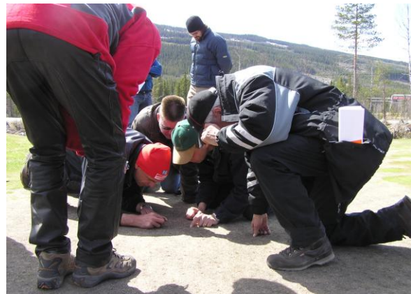
Når årsaken er kompleks, er det mange meninger.

Ofte ser vi at greenen er grønne når de kommer ut av snø eller is om våren, men så dør de ganske raskt etterpå. Det kan skyldes frysetørking. De små plantene, som nesten ikke har røtter, (for de er revet av på grunn av telehiv) tåler lite sol og vind. Det er derfor risikabelt å fjerne is og snø for tidlig også.