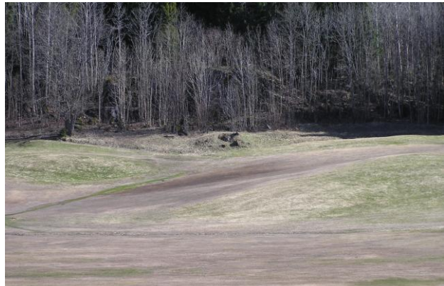
Isdekke har knekket mange fairwayer i vinter

Denne vinteren er det svært store vinterskader i et belte noen mil inn fra kysten rundt hele Sør-Norge. Kystnære baner har derimot klart seg bra mange steder. I innlandet har det vært mye, stabil snø og mange baner der også har klart seg bra. I mellomsonen har langvarig isdekke drept gresset. Der greenkeeperne har klart å knuse isen på greenene, og dermed berget dem, har ofte fairway dødd ut. Ingen golfbaner har nok ressurser til å holde hele banen isfri.