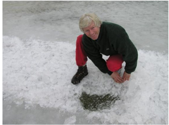
Vinterarbeid på golfbanen kan ikke gjøres i ferien.

Og hvis greenkeeperen blir gjort oppmerksom på disse skadene hver dag hele sommeren, så kanskje golferne må stelle gresset selv neste år. For greenkeepere er som gresset på greenene. Det tåler utrolig mye tråkk og slitasje, men må stelles med kjærlighet og forstand.